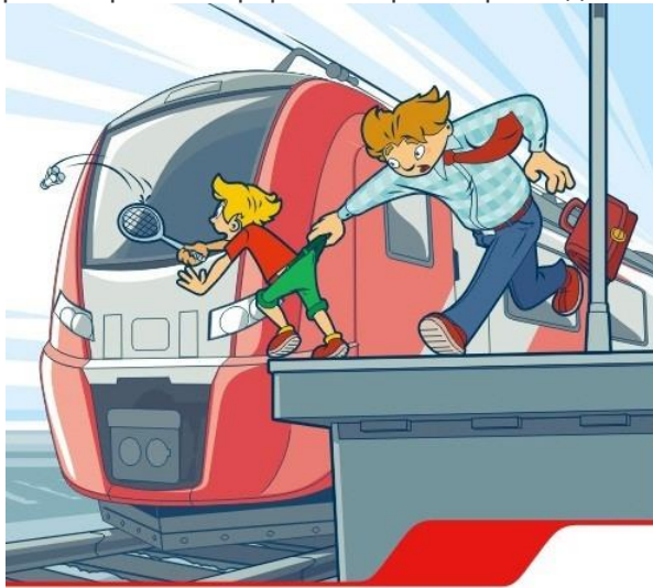
Платформа – не место для игр!