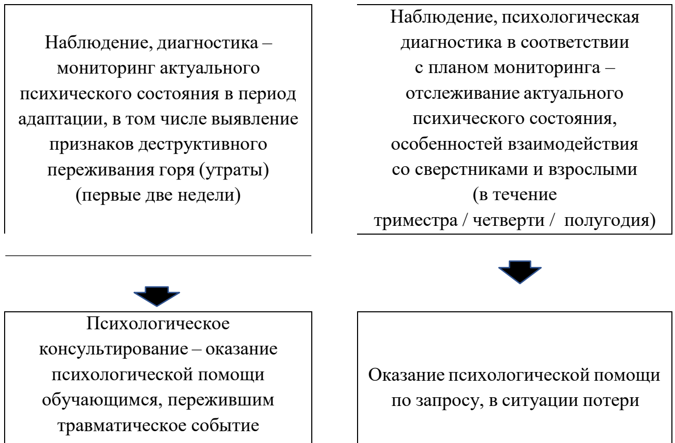
Схема выстраивания работы педагогов-психологов / психологов по психологическому сопровождению детей ветеранов (участников) СВО в зависимости от статуса пребывания обучающегося в образовательной организации

При необходимости педагогом-психологом / психологом осуществляется коррекция психолого-педагогических рисков, трудностей в проявлении состояний, поведении, адаптации и содействие социально-психологической реабилитации детей участников СВО.